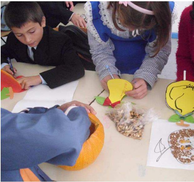
Carticica cu poezii !