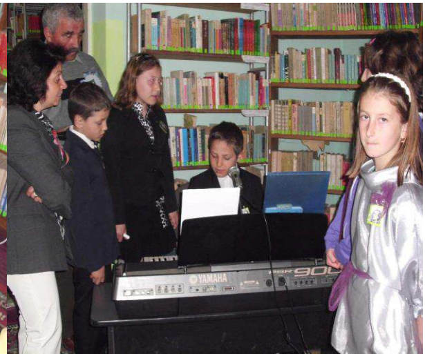
Scoala ...altfel !