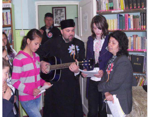
Microexpozitie de carte consacrata anului „2012 - Anul CARAGIALE”