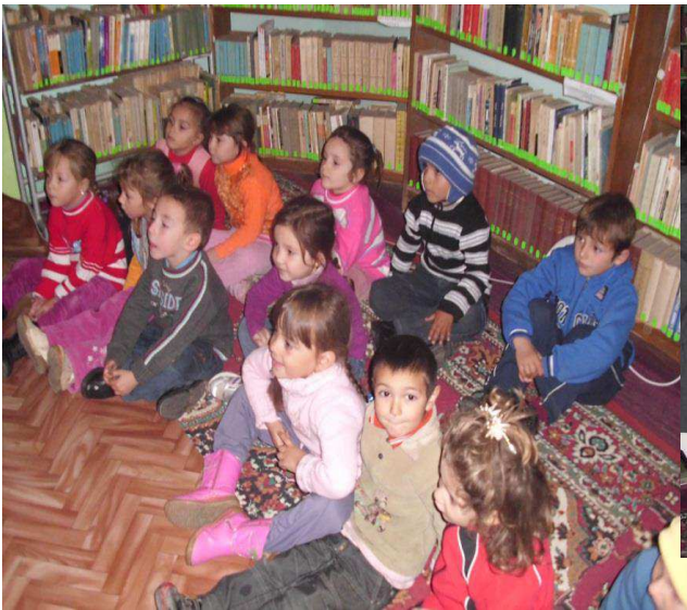
Cinema cu povesti !