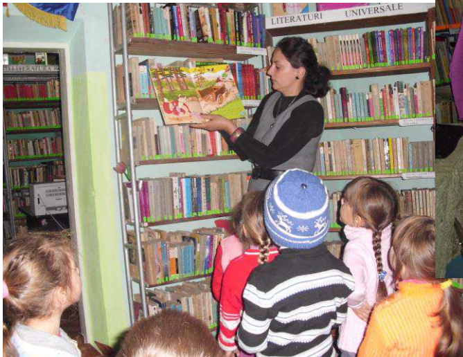
O ora in biblioteca