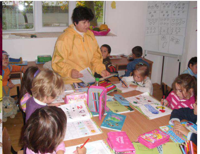
Rapsodii de toamna !