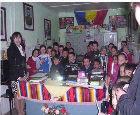
Concurs interscolar, „Pe urmele lui Creanga’