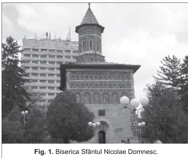
Fig. 1. Biserica Sfântul Nicolae Domnesc.

Deși era biserică curții domnești, acest edificiu a căzut de nenumărate ori pradă incendiilor, care la vremea respectivă erau fenomene obișnuite, mai ales pe timpul verii. Mizeria din târgurile medievale, perisabilitatea materialelor de construcție a caselor, lipsa apei adusă sistematic în oraș, inexistența unui