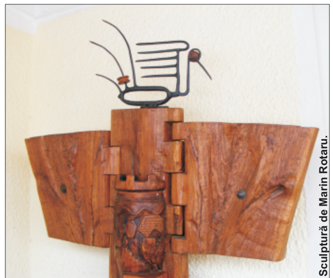
Sculptură de Marin Rotaru.

Sub lespezi de vreme viermuesc amintiri. Ușa cu zăvoare stă ferecată, Vântul spulberă făr-a se teme Fantomă venită din prime iubiri la judecată. Judele bate în timp, Se așterne tăcere, Barca plutind sub raze de nimb Poartă plutașul în valuri nu pierе. Dincolo, Dincolo e țărmul – Ultimul liman Fără luceferi, Doar nopți de catran.